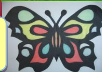
spacery, gry i zabawv